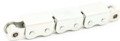
Verzinkte Rollenketten Zinc-plated chains

Alle Rollenketten der METEOR Kettenfabrik GmbH sind auf Anfrage in verzinkter oder vernickelter Ausführung erhältlich. Die Beschichtung der Rollenketten mit Nickel oder Zink sichert den perfekten Schutz vor Korrosion, d. h. ermöglicht ihre Anwendung in Salzlösungen, korrosiver Umgebung, sowie auch an Orten mit hoher Luftfeuchtigkeit. Der Überzug wird auf den unterschiedlichen Ketten gemäß ISO/DIN und ANSI Normen ausgeführt. Solche Ketten sind geeignet für die Lebensmittelindustrie, die Textilindustrie und weitere Branchen, wo Sauberkeitsanforderungen besonders hoch sind.