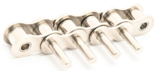
Vernickelte Rollenketten Nickel-plated chains